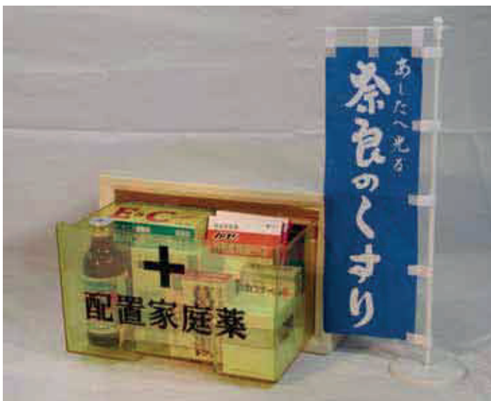
奈良の配置薬

せんようこうり 昔ながらの「先用後利」の理念を守りながら、こきやく 顧客が望むサービスに対応していくことが、業績を伸ばしているのではないのでしょうか。