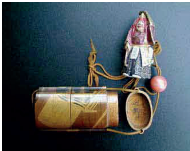
行商の旅の携行品（印籠・根付）

昭和40年代までは、奈良県出身の配置員が4,000人以上いましたが、その後、各地域での配置員の数も増え、現在は当時の五分の一の人数となっています。奈良県出身の配置員は、自ら全国各地を回商し、1年の多くを地方で過ごす形態で配置販売業を営んでいます。