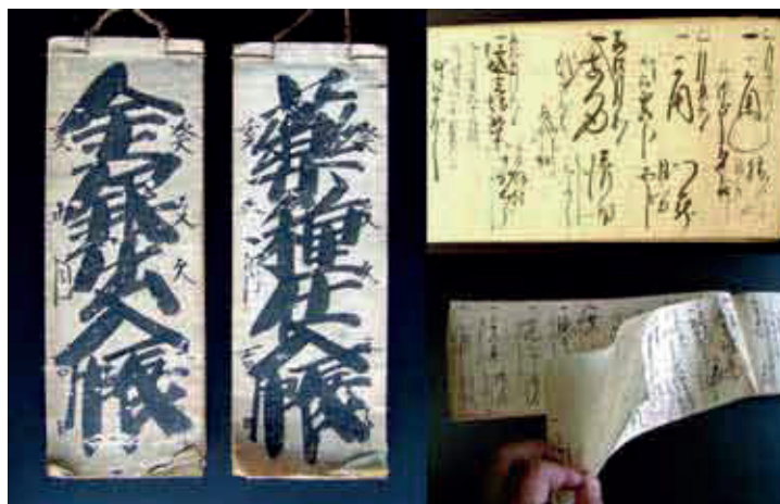
金銀出入帳及び薬種仕入れ帳

また、奈良県内の製造企業も、この時期に合わせて重点的に生産をします。そのため、お盆前と年末は製造が忙しくなります。また、お盆と正月の時期には配置員の持つ薬の補充や交換（期限の迫ったと新しい薬の交換）の手伝いをすることもあります。